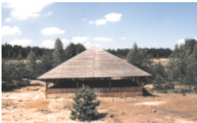
Rezerwat przyrody nieożywionej „Gagaty Sołtykowskie”

Gagat, zwany też bursztynem czarnym lub czarną ambrą - to osobliwa, bitumiczna odmiana węgla brunatnego o smolisto-czarnej barwie, dająca się obrabiać i polerować, stąd też wykorzystywana bywa często w jubilerstwie. Na terenie wyrobiska kopalni w Sołtykowie odkryto pięknie zachowane ślady tropów dużego dinozaura. Badania wykazały, że zlokalizowane tutaj ślady (odciśnięte tropy) należały do dilofozaura. Na terenie rezerwatu odkryto także ślady jednego z najstarszych zauropodów, jakie stąpały po Ziemi. Zauropody pojawiły się na Ziemi na samym początku okresu jurajskiego. W Sołtykowie oprócz tropów dinozaurów zachowały się również zwęglone szczątki flory kopalnej.