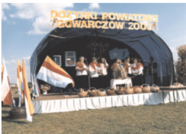
Dożynki Powiatowe - Gowarczów - 2003 r.