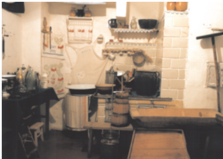
Wnętrze Muzeum Etnograficzno-Historycznego w Falkowie

Kultura ludowa jest istotnym składnikiem dziedzictwa kulturowego regionu i jego tożsamości. Jest dobrem samym w sobie, które powinniśmy chronić i kontynuować.