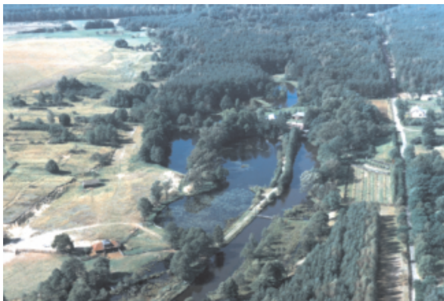
Kompleks stawów rybnych w Rudzie Malenieckiej

Tereny podmokłe urzekają bogactwem ornitofauny. Można tu spotkać: błotniaka stawowego, żurawia, bociana czarnego, zielonkę, perkoza, a także wiele gatunków nie lęgowych, tj. rybołowa, kormorana, czapłę białą, a przede wszystkim rzadkiego w Polsce i Europie orła bielika. Mają tu swoje siedliska wydry i bobry. Z rzadko spotykanej roślinności można wyróżnić: kilka gatunków widłaka, bluszcz pospolity, kruszynę pospolitą, długosza królewskiego.