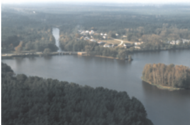
Zalew w Sielpi

Sielpia jest malowniczą miejscowością letniskowa, położoną w gminie Końskie nad zalewem na rzece Czarnej Koneckiej. Główną atrakcją letniska jest 58-hektarowy zbiornik wodny, będący bazą do uprawiania sportów wodnych, kąpieli i wędkowania. Dodatkowym atutem Sielpi jest jej usytuowanie - z dala od dużych ośrodków przemysłowych oraz otaczające ją, rozległe i bogate w grzyby lasy sosnowe, tworzące mikroklimat wpływający pozytywnie na schorzenia górnych dróg oddechowych. Miejscowość ta, wraz ze znajdującym się tutaj Muzeum Zagłębia Staropolskiego, unikatowym w skali europejskiej zabytkiem techniki, stanowi sama w sobie atrakcję turystyczną. Ponadto ze względu na swe korzystne położenie jest doskonałym punktem wypadowym dla wycieczek pieszych, rowerowych i autokarowych w pobliście Góry Świętokrzyskie. Oprócz bazy hotelowej i dużego kompleksu domków campingowych w Sielpi znajduje się również pole namiotowe.