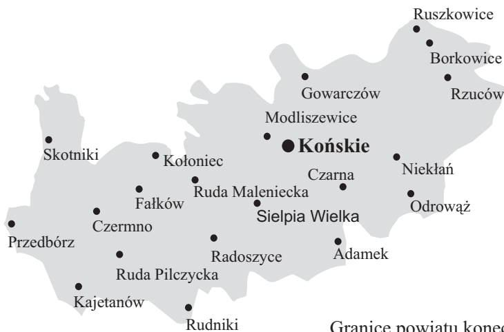
Granice powiatu koneckiego w 1938 roku.