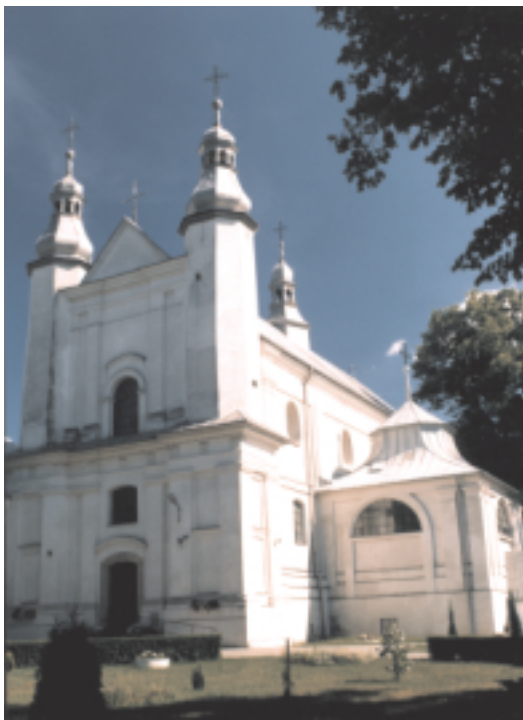
Kościół parafialny w Kazanowie