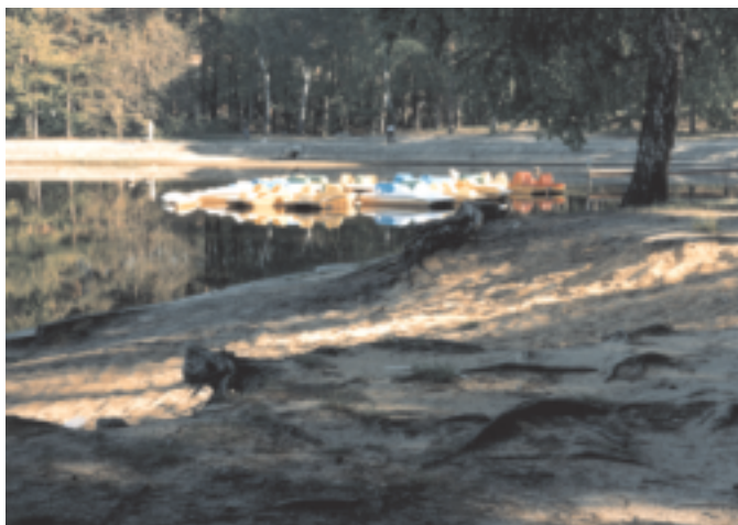
Fragment zalewu w Sielpi