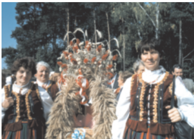
Dożynki Powiatowe-Słupia-2000 r.

kościelnych, jak np. w Radoszycach w święto Bożego Ciała oraz w święto plonów - - dożynki (Słupia, Gowarczów).