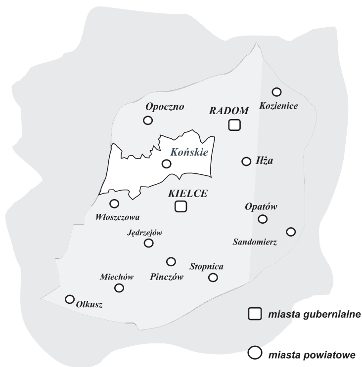
Podział administracyjny Guberni Radomskiej i Kieleckiej w 1867 roku.

Najstarsze ślady osadnictwa na terenie samych Końskich pochodzą z XI wieku, jednak pierwsze źródła pisane dotyczące osady, powstały w XII wieku (1124 r.), kiedy to właścicielem Końskich był możny ród Odrowążów. To oni ufundowali kościół, wokół którego ukształtowało się przyszłe miasto.