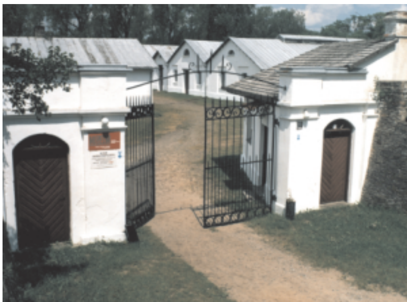
Muzeum Zagłębia Staropolskiego w Sielpi

Inne historyczne już ośrodki przemysłu nad rzeką Czarną Konecką to: Janów, Małachów, Wąsosz i Sielpia. Zbudowany w latach 1824-1842 zakład metalowy w Sielpi pracował do roku 1921, a w 1934 r. został przekształcony w Muzeum Techniki. Inicjatorami budowy zakładu byli Stanisław Staszic i książę Ksawery Drucki-Lubecki. Jednym z budowniczych był znany francuski inżynier, twórca fabryk w Żyrardowie, Filip de Girard. Zakład składał się z głównej hali produkcyjnej, gdzie napęd maszyn i urządzeń zapewniały dwa żelazne koła wodne, z których większe o średnicy 8,5 m i wadze ponad 80 ton, ze względu na swoją wagę i solidność konstrukcji, ocalało w czasie II wojny światowej, a obecnie jest uruchamiane przy okazji corocznych „Kuźnic Koneckich” i innych ważnych okoliczności. W hali tej znajdowały się piece pudlingarskie służące do produkcji wysokiej jakości stali oraz walcarki, młoty i inne urządzenia do wytwarzania wyrobów z tej stali. Wszystkie urządzenia zakładu wykonane były przez polskie zakłady w Białogonie, Rejowie i Starachowicach. Obecnie, poza wspomnianym już największym w Europie kołem wodnym w sielpiańskim muzeum, będącym filią „Muzeum Techniki NOT” w Warszawie, podziwiać można wiele XIX-wiecznych maszyn i urządzeń, a już wkrótce zrekonstruowany będzie piec pudlingarski. Przy zwiedzaniu należy zwrócić uwagę na kryty kanał, odprowadzający wodę od koła wodnego do rzeki.