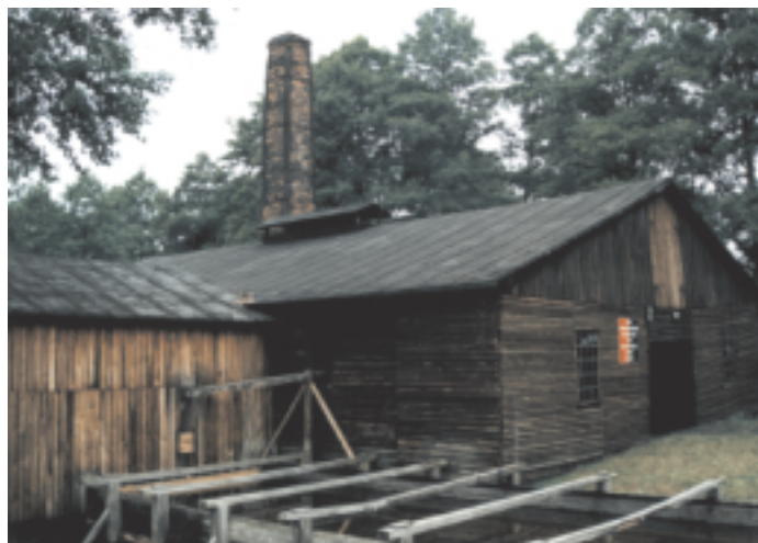
Zabytkowy Zakład Hutniczy w Maleńcu