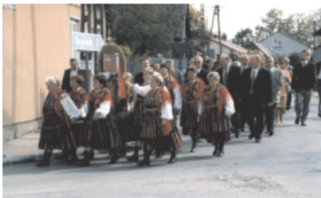
Dożynki Powiatowe-Gowarczów-2003 r.