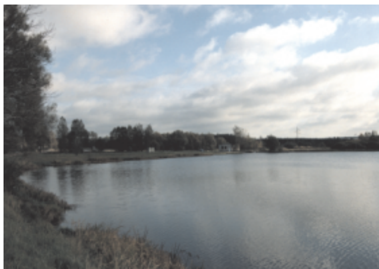
Zalew „Miła” na rzece Czarnej Koneckiej w Staporkowie

Oprócz wspomnianych ujęć w każdej z pozostałych gmin występują lokalne ujęcia wód podziemnych, utworzonych na lokalnych zbiornikach wód podziemnych, przeważnie tego samego piętra stratygraficznego, co KGZWP. Ponadto nadal bardzo popularne są w gospodarstwach indywidualnych studnie, w których w zależności od warunków geologicznych drenowane są poziomy wodonośne, bardzo płytkie (tzw. studnie wierzchówkowe), jak i głębsze poziomy wód podziemnych, najczęściej gruntowych.