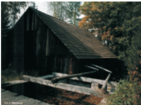
Zabytkowa kuźnia wodna w Starej Kuźnicy

Są również regiony i miejsca mniej znane, ale równie urokliwe i bogate przeszłością swoich przodków, do których na pewno możemy zaliczyć ziemię konecką. Położona na wyżynie kielecko-sandomierskiej w północnej części województwa świętokrzyskiego jest miejscem o bogatej przeszłości, która pozostawiła tu swoje liczne ślady. Dziedzictwem tej ziemi są niewątpliwie tradycje przemysłowe.