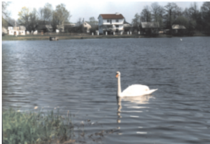
Zbiornik wodny w Maleńcu