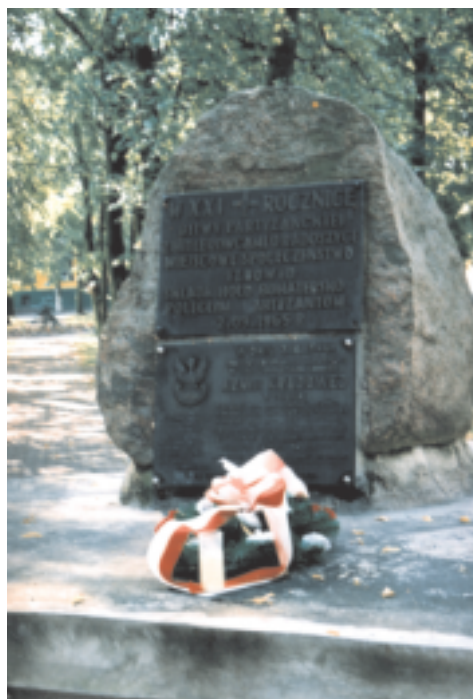
Pomnik upamiętniający pacyfikację Radoszyc przez Niemców

naturalnych zbiorników retencyjnych (terenów podmokłych, torfowisk, oczek wodnych, nieuregulowanych odcinków cieków). Na teren gminy w północno-zachodnią jej część wchodzi fragment węzła ekologicznego o znaczeniu krajowym. Jest to obszar przedborski. Obejmuje on najwartościowsze fragmenty Wyżyny Przedborskiej, Małogoskiej i Garbu Gielniowskiego. W skład tego węzła wchodzi biocentra, strefy buforowe, oraz korytarze ekologiczne (na terenie gminy fragment korytarza ekologicznego 59 k - Czarnej Koneckiej). Przez teren gminy przebiega 1 znakowany szlak turystyczny (Góra Dobrzeszowska - Gruszka - Górniki - Mościska - Sielpia Wielka), który nadaje się zarówno do uprawiania turystyki pieszej, jak i częściowo także rowerowej.