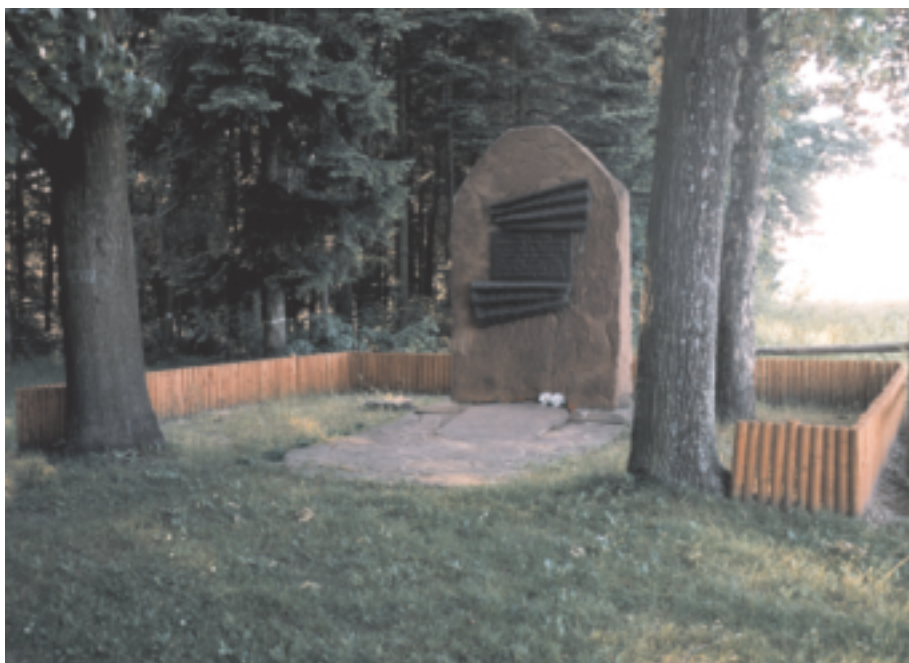
Pomnik upamiętniający bitwę pod Gruszką 29 września 1944 roku