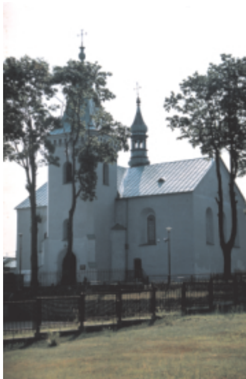
Kościół parafialny w Radoszycach

Huty, zużywając ogromne ilości drewna na opał, tworzyły wokół siebie rozległe poręby, które łatwo mogły być przystosowane do uprawy.