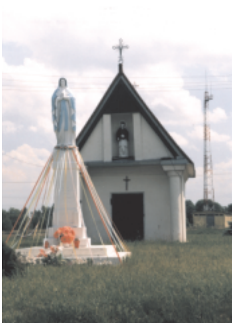
Zabytkowa kapliczka w Radoszycach

W drugiej połowie XIX w. nastąpiły zmiany w organizacji górnictwa i hutnictwa rządowego. Zmieniły się procesy technologiczne, nastąpiła wyprzedaż zakładów przemysłu żelaznego w ręce kapitału prywatnego. Ziemia została przyznana włościanom na własność. Miasto Radoszyce około 1885 r. liczyło 3169 mieszkańców, miało rozwinięty handel i rzemiosło. Wyrabiano tu między innymi bryczki i wozy konne (ok. 3000 szt. rocznie), które sprzedawane były na jarmarkach w całym Królestwie.