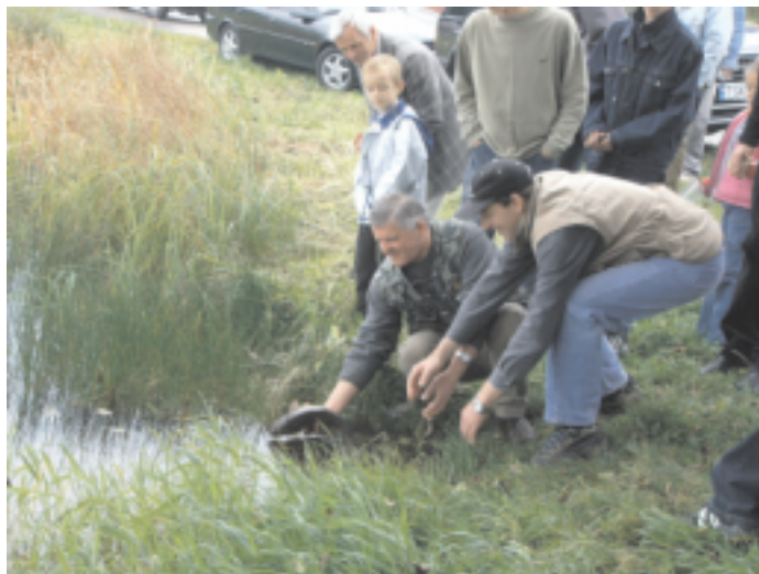
Ceremonia ułaskawienia karpia, podczas „Święta Hodowców Ryb i Wędkarzy-Konecka Ryba”

W pobliskich olsach można spotkać rzadkie gatunki roślin: wawrzyńka wilczełyko, widłaka wronca a na sąsiadujących z nimi łąkach kosaćca syberyjskiego. Potwierdzeniem czystości wód jest obecność raka szlachetnego, a także przepięknych okazów okoni i płoci. Występują również sandacze, szczupaki, kielbie, karpie, ukleje, sumiki karłowate i różanki. Starostwo Powiatowe, co roku jesienią, organizuje w Maleńcu, „ Święto Hodowców Ryb i Wędkarzy - Konecka Ryba ”.