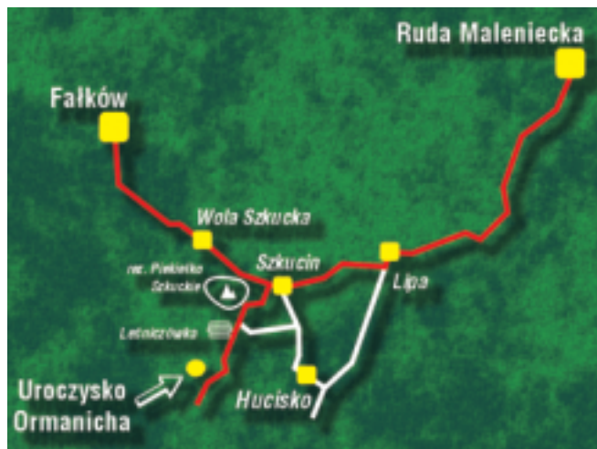
Mapka szlaku do „Uroczyska Ormanicha”