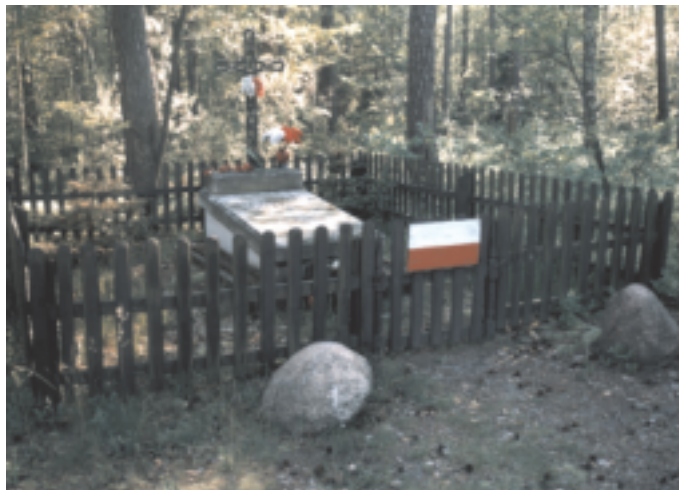
Uroczysko Ormanicha koło Szkucina. Pomnik powstańców 1863 r.