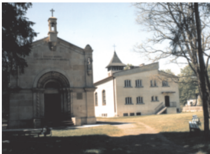
Kaplica z 1848 r. w tle kościół parafialny z 1982 r. w Rudzie Malenieckiej