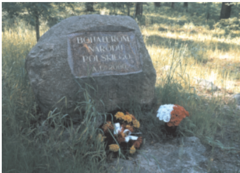
Uroczysko Ormanicha koło Szkucina. Pamiątkowy Głaz ufundowany przez leśników z Nadleśnictwa Ruda Maleniecka w 2000 r.

Atrakcją turystyczną stanowi również rezerwat przyrody „Piekło” w Szkucinie oraz gład narzutowy w Lipie.