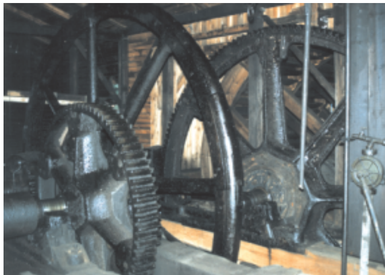
Wnętrze zabytkowej walcowni z XIX w. w Malenecu (Zabytkowy Zakład Hutniczy)

Maleniec - wieś leżąca przy starej szosie Łódź - Kielce nad rzeką Czarną Konecką, która była źródłem energii dla wybudowanych dawniej nad jej brzegami zakładów przemysłowych. Tutaj znajduje się unikatowy w Europie zabytek techniki z zachowanym pełnym cyklem technologicznym - walcowania blach, z których wytwarzano łopaty i szpadle - niesłusznie nazwany zakładem staszycowskim.