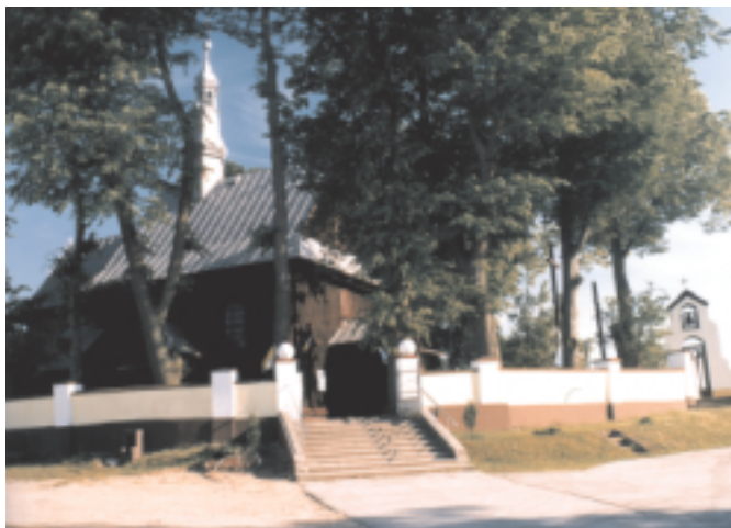
Kościół parafialny w Lipie